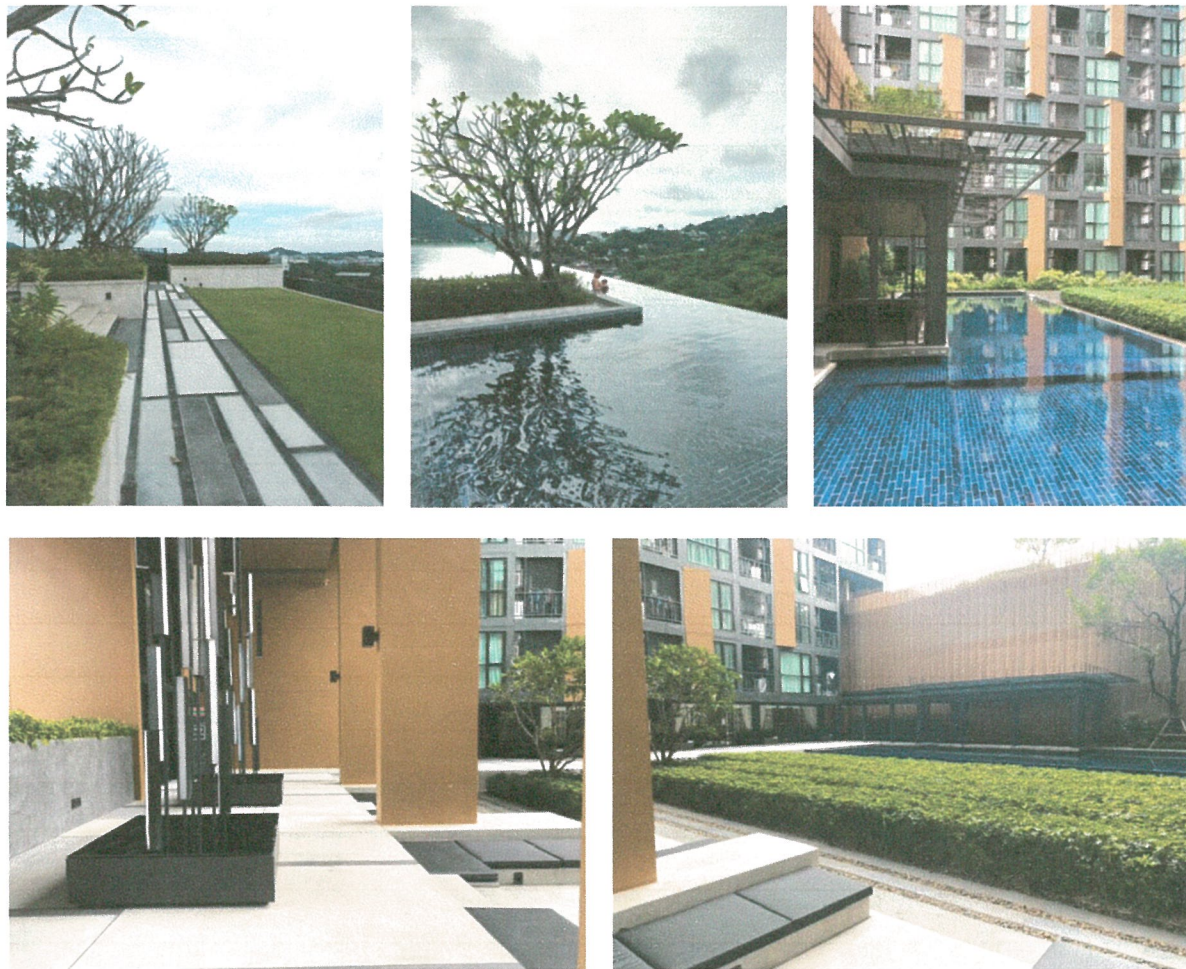
รูปภาพที่ 1.4 การใช้พื้นที่อาคาร