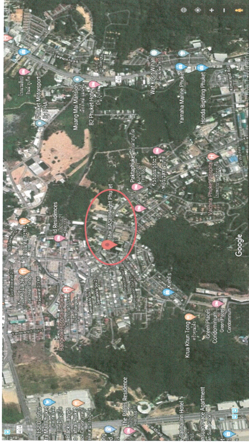
รูปภาพที่ 1.1 แผนที่ตั้งของโครงการ เดอะ เบส โฮท์-ภูเก็ต (Top View)